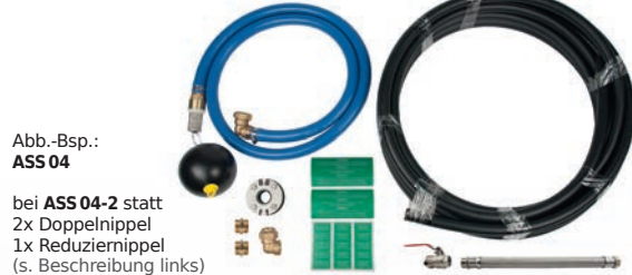
Abb.-Bsp.: ASS 04

bei ASS 04-2 statt 2x Doppelnippel 1x Reduziernippel (s. Beschreibung links)