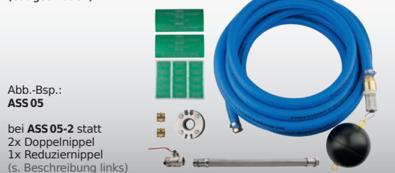
Abb.-Bsp.: ASS 05

bei ASS 05-2 statt 2x Doppelnippel 1x Reduziernippel (s. Beschreibung links)